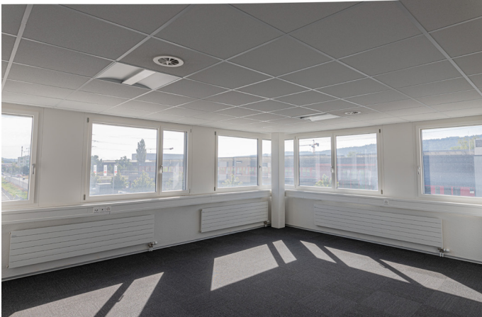
Büro 2.4 | 2.0G